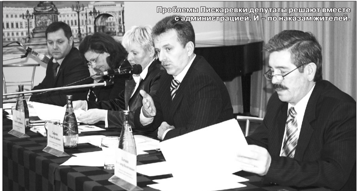
Проблемы Пискаревки депутаты решают вместе с администрацией. И – по наказам жителей.

В ответе на запрос сказано, что действительно, надземный переход, построенный еще в 50-е годы прошлого столетия, «морально и в значитель-