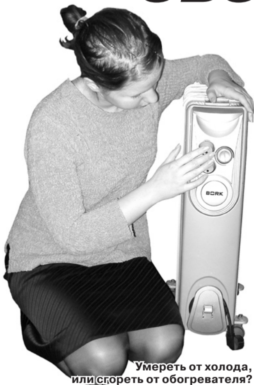
Умереть от холода, или согреть от обогревателя?

Одной из причин возникновения пожаров в жилом секторе является нарушение требований пожарной безопасности при эксплуатации электронагревательных приборов.