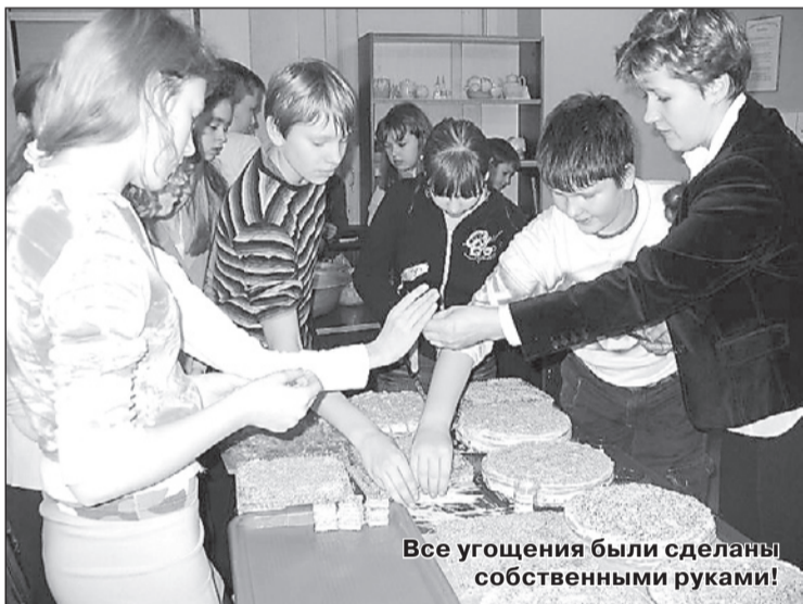
Все угощения были сделаны собственными руками!

ках рисования (педагог – М. А. Ронис ). А завершился праздник фуршетом – мам угощали вкусными бутербродами, которые приготовили сами дети.