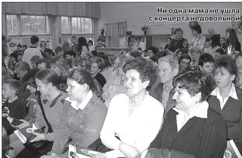
Ни одна мама не ушла с концерта недовольной

Всем зрителям запомнились смешные конкурсы для мам и их детей: «запеленать» и одеть в чепчик свое великовозрастное дитя, подбросить в воздух и поймать скорородкой блин, угадать по уморительно-красноречивым жестам задуманное слово или фразу. Никто не ушел со сцены без подарка, а зрители поддерживали конкурсантов и активно болели за них. Кроме призов мамы получили расписные кружки, изготовленные на уро-