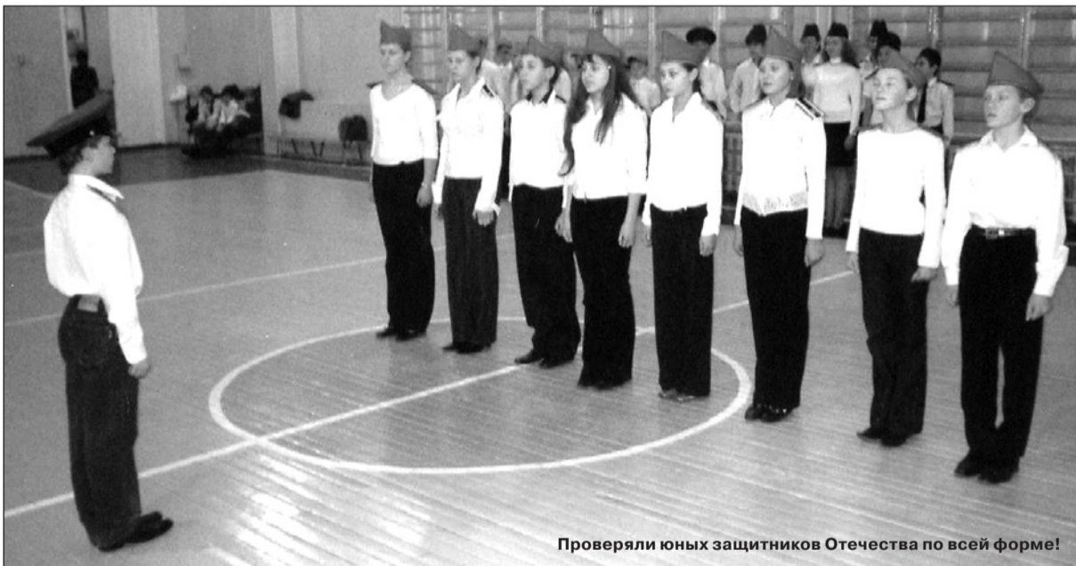
Проверяли юных защитников Отечества по всей форме!