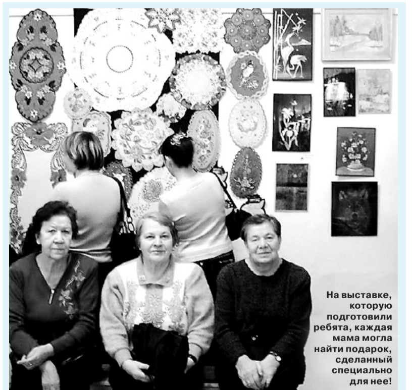
На выставке, которую подготовили ребята, каждая мама могла найти подарок, сделанный специально для нее!